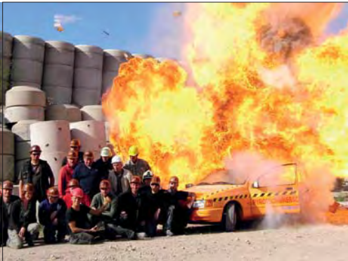
Die praktische Prüfung der Pyrotechnikerschule: Nahbereichs-Autoexplosion