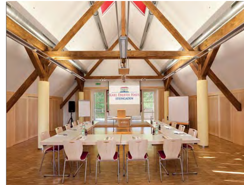
Der Unterrichtsraum für den theoretischen Unterricht