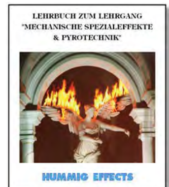
496 Seiten / 258 Abbildungen ISBN 978-3-931360-46-7