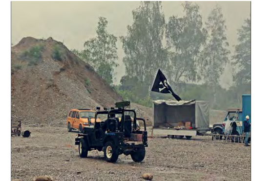
Die praktische Prüfung der Pyrotechnikerschule: „Übungsszene mit Jeep und div. Explosionen“