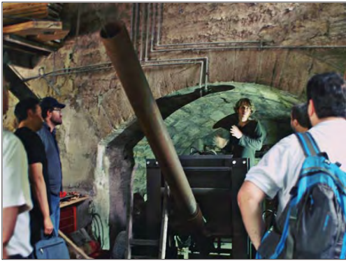
Die praktische Prüfung der Pyrotechnikerschule: „Autokanone - siehe Bild rechts“