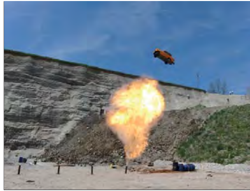
Praktische Übung: Autokanone mit 1,3 kg Schwarzpulver geladen zum Auto weg schießen