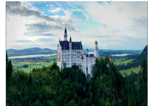
Der Tagungsort befindet sich im malerischen Pfaffenwinkel. Das berühmte Schloss Neuschwanstein ist nur 20 Min entfernt.