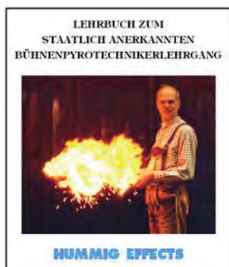
477 Seiten / 214 Abbildungen ISBN 978-3-931360-13-9