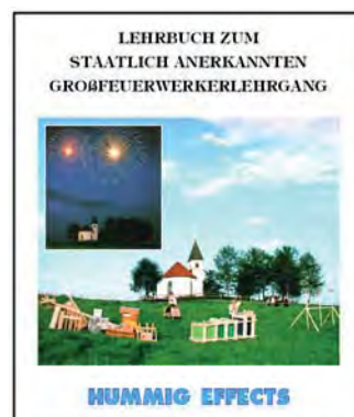
520 Seiten / 280 Abbildungen ISBN 978-3-931360-32-0