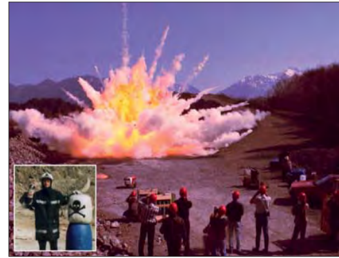
Die praktische Prüfung (1999) der Pyrotechnikerschule: „Mehlstaubexplosion“