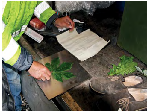
Praktische Übung: Einsprengereffekt eines Gegenstandes in eine Metallplatte