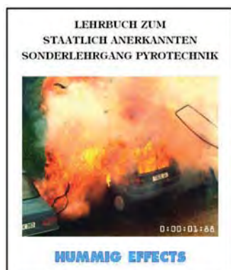
608 Seiten / 335 Abbildungen ISBN 978-3-931360-22-1