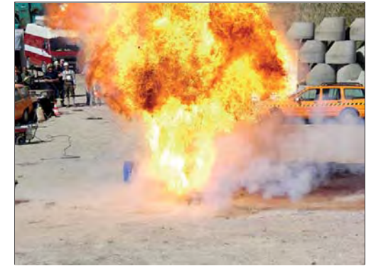
Die praktische Prüfung der Pyrotechnikerschule: Sprengschnur mit Benzin