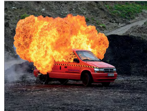
Die praktische Prüfung der Pyrotechnikerschule: Benzinexplosion