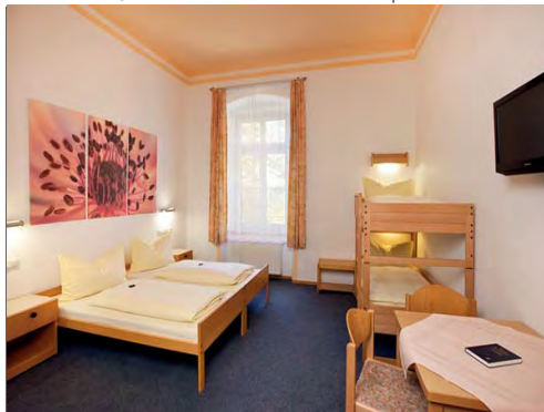
Jeder Teilnehmer verfügt über ein Einzelzimmer mit Bad, WC und TV